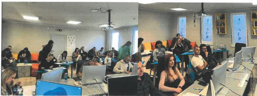
Slika 1: Preduzetnička obuka Bijeljina, 2024

U skladu sa očekivanjima, tokom treninga došlo je do smanjenja grupe učesnika tako da je u konačnici 14 učesnika uspješno završilo obuku a 11 predstavilo svoje poslovne ideje.