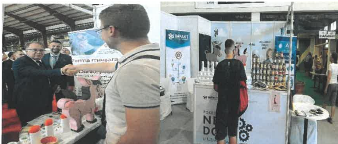
Slika 5.- Međunarodni sajam u Gradačcu