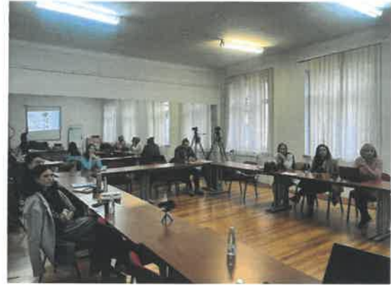
Slika 4. PCM obuka osnovni nivo, Tuzla, 2024

Pored obuke, angažovani stručnjak je pružio i stručnu i mentorsku podršku učesnicima obuke, kroz davanje povratnih informacija na zadatke u okviru vježbi koje su korištene kao i odgovorima na pitanja učesnika.