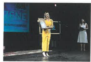
Slika 3. Festival savremene žene Tuzla 2024