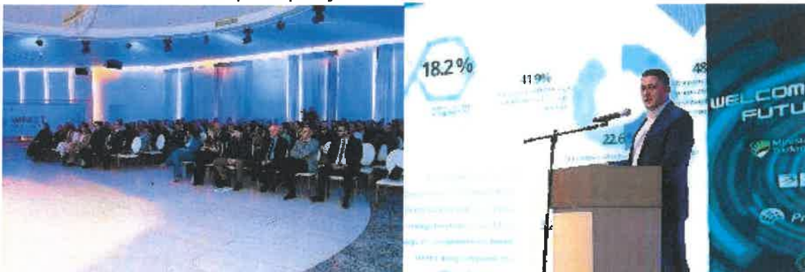
Slika 8. Welcome to the Future 3.0