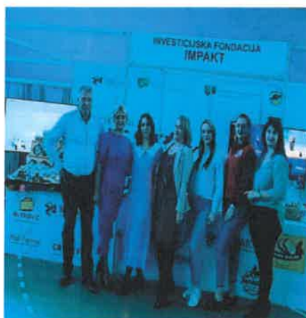
Slika 6. Učesnici sajma sa ministrom MKSM TK i predstavnicom Impakt fondacije

Posjetitelji su imali priliku probati i kupiti raznolike proizvode od jagodastog voća, uključujući svježe jagode, džemove, sokove i mnoge druge proizvode. Sajam je također bio prilika za promociju lokalnih proizvođača i njihovih proizvoda te podizanje svijesti o važnosti podrške domaćoj poljoprivredi i prehrambenoj industriji.