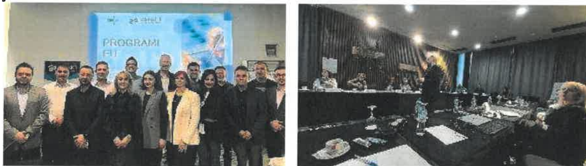
Slika 12. Sastanak koordinatora, decembar 2024.

Također, fokus je bio na EU fondovima i statusu Bosne i Hercegovine kao zemlje kandidatkinje. Kroz brojne studije slučaja o uspješnom korištenju EU fondova u Hrvatskoj, učesnicima je približen način na koji mogu iskoristiti mogućnosti koje će uskoro biti dostupne za BiH. Učesnici su takođe radili na identifikaciji i razvoju projektnih ideja za jačanje lokalne privrede i preduzetništva, te su analizirali usklađenost ovih ideja sa strateškim dokumentima EU. Predstavljeni su im i pojedinačni program EU koje mogu koristiti, a na konkretnim primjerima su radili na razradi projektnih ideja za svoje lokalne zajednice.