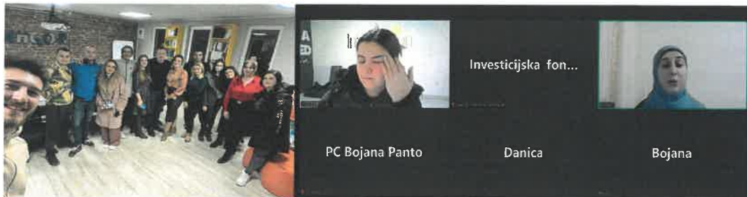
Slika 9. Grupni i individualni mentoring IMPAKT Bijeljina 2024