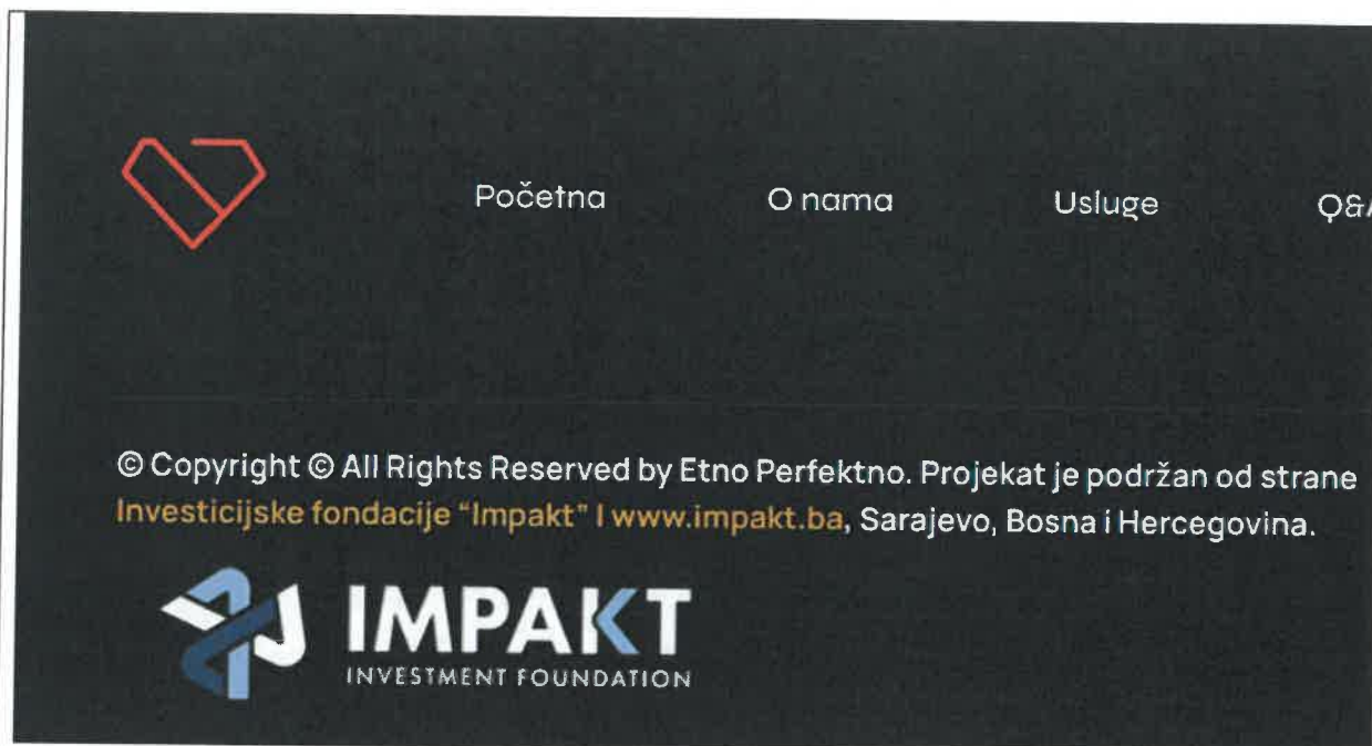
Slika 10. Web stranica Etno perfektno preduzetnice Violete Krajišnik izrađena u okviru mentorske podrške Fondacije Impakt

Investicijska fondacija Impakt kontinuirano promovira preduzetnike i kreira im prilike za medijsko gostovanje čime smo značajno doprinijeli vidljivosti programa koji se realizira u saradnji s Gradom Bijeljina