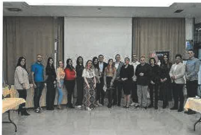
Slika 2: Finalna prezentacija IMPAKT inkubator poslovnih ideja Bijeljina 2024

Rang lista prezentiranih poslovnih ideja u okviru IMPAKT inkubatora poslovnih ideja grada Bijeljina je potpisana od strane sva tri člana, te je svaki član zadržao svoj primjerak.