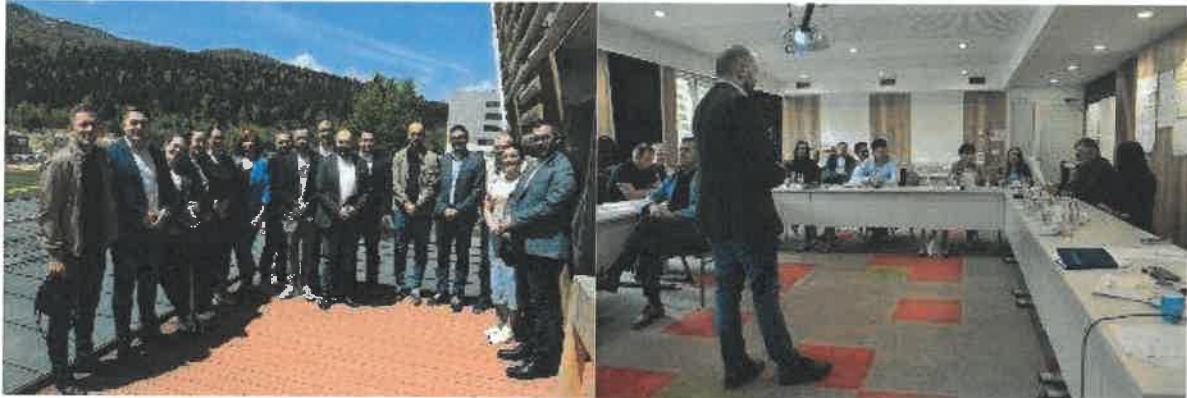
Slika 11. Sastanak koordinatora, maj 2024

Glavna tema bila je buduća perspektiva inkubatora, gdje smo diskutovali o identifikaciji aktera na lokalnom nivou kroz matricu uticaja, a urađena je i analiza identificiranih aktera te definisani su naredne koraci za IMPAKT inkubator i Akcelerator.